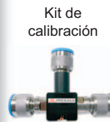
Kit de calibración

Con la terminación de la medida de potencia y la medida de potencia del espectro de frecuencia digital In-line, puede comprobar una gran variedad de señales, satisfaciendo la demanda de diferentes niveles de usuarios.