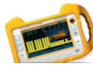
RANGER Neo Lite