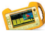
HD RANGER Eco