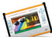
HD RANGER UltraLite