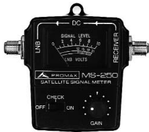
MS-250 ■ Detector de satélites