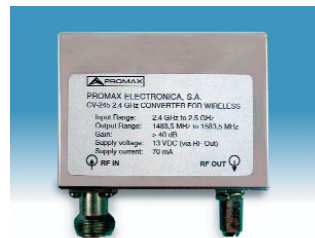
CV-245 ■ Conversor banda 2,4 GHz

Permite ampliar en 20 dB el margen dinámico de los medidores