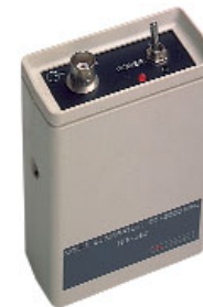
NG-281/NG-282 ■ Generadores de ruido