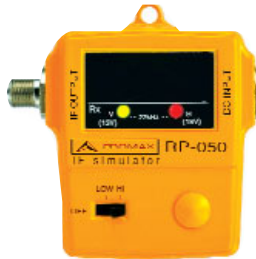
RP-050 ■ Simulador FI de satélite