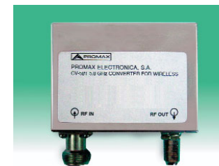
CV-589 ■ Conversor banda 5,8 GHz